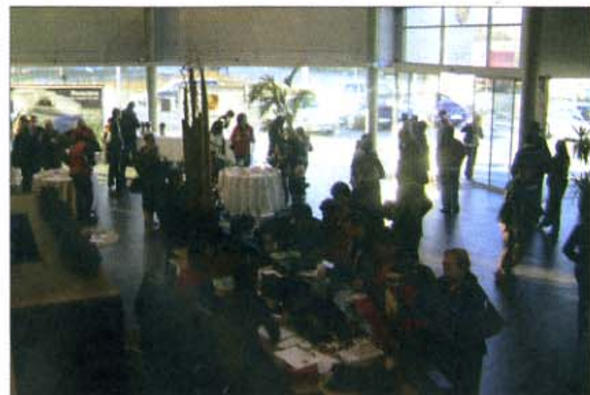
L'esmorzar servit a clients i amics al concessionari abans d'anar cap a Cardona.

El Porsche Cayenne va ser un dels vehicles oficials del saló. Els cotxes demo de la prestigiosa marca es van posar a disposició de la Fira per al trasllat dels organitzadors i personalitats –com Àlvaro Domecq, per exemple– que