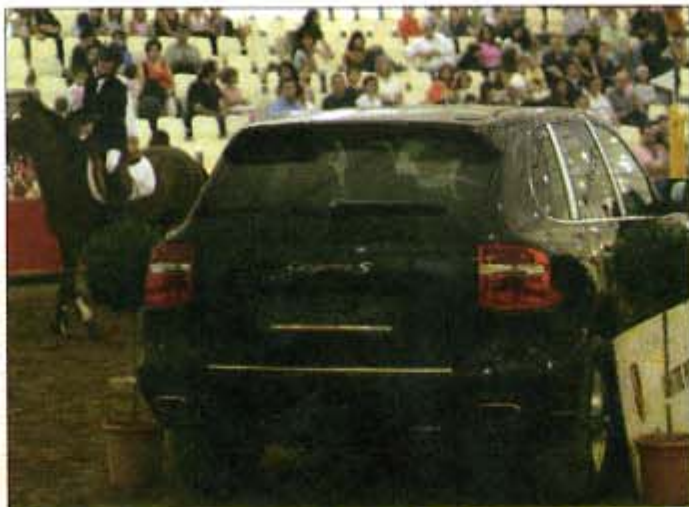
El Cayenne va ser un dels vehicles oficials del darrer Equus Catalonia.

El patrocini de la darrera edició de «l'Equus Catalonia» amb el Cayenne com un dels vehicles oficials, i la celebració d'una ruta amb vehicles de la marca cap a Cardona són els darrers actes organitzats pel centre Porsche Girona per als seus clients i amics.