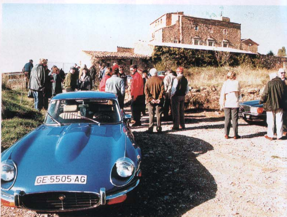
Vistes del Castell de Vilarig. Populars i esportius junts.

La Ruta va consistir, com cada any, en un seguit de visites turístiques i culturals, on s'explicava la història i l'arquitectura de cadascun dels castells o cases fortificades visitades. El primer dia es visità el palau de Foixà, el Castes de Torcafelló, el castell de Brunyola i la vall de Sant Aniol, inclòs el seu propi manantial (gentilesa d'Aigües de Sant Aniol). El segon dia i després de pernoctar en l'hotel Goya Parc, la caravana es dirigí a visitar el castell i el veïnat de Vilarig, la vil·la closa de Sant Llorenç de la Muga i el seu castell. Després d'un bon dinar es va fer el lliurament de trofeus, donant-se per acabada aquesta XII Ruta dels Castells del Motor Club Girona.