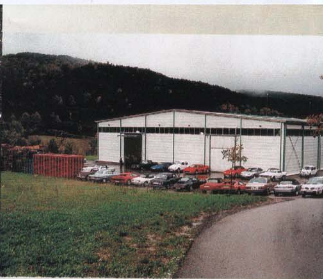
Vista panoràmica de les instal·lacions d'Aigües de Sant Aniol, Sant Aniol de Finestres.