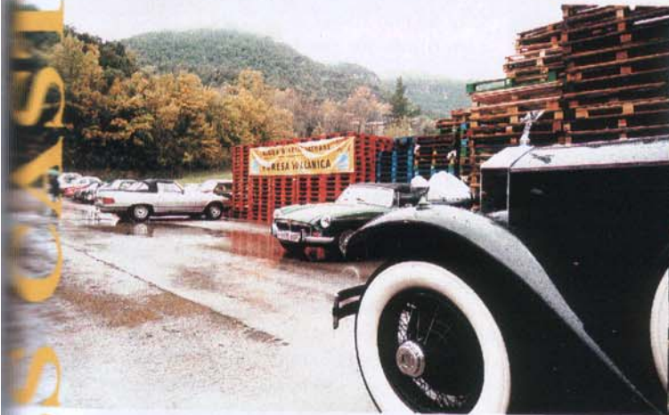
Sant Aniol de Finestres.