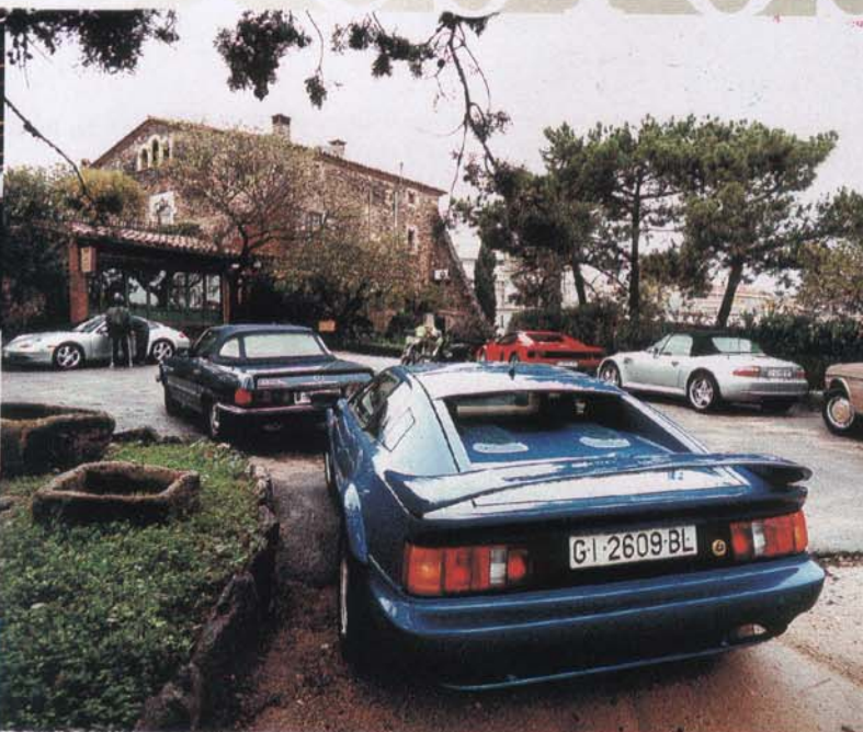
Maçanet de la Selva, Palau de Foixà, vista panoràmica amb alguns dels cotxes participants.