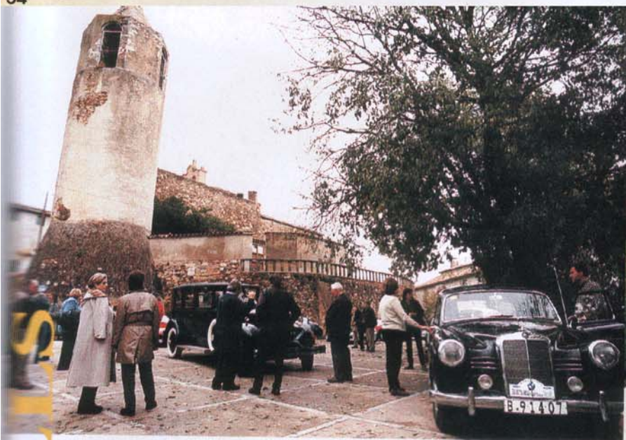
Vista del Castell de Brunyola.